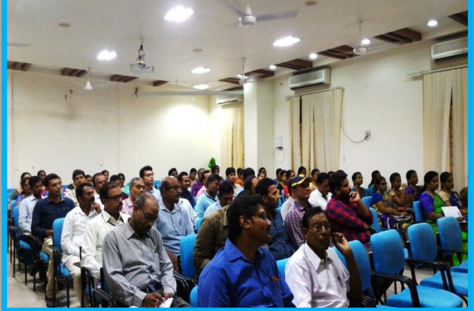
Faculty listening to the lecture