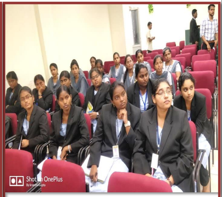
Students at the Guest Lecture