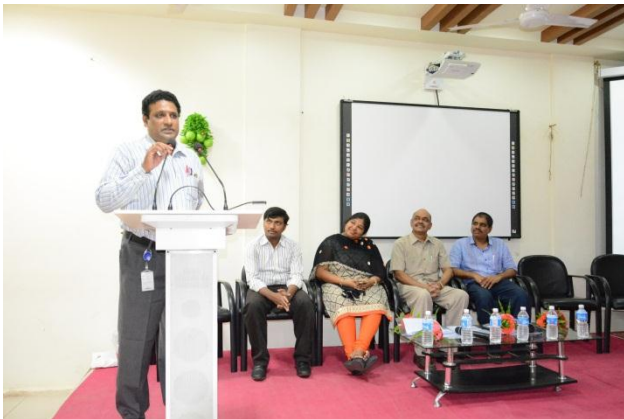
Invited speech by Prof. & Head Dept. of Computers, PSCMR College of Engineering & Technology