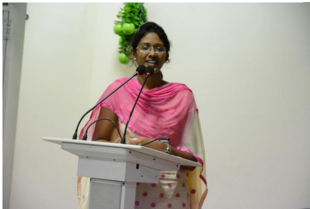
Feedback by the students