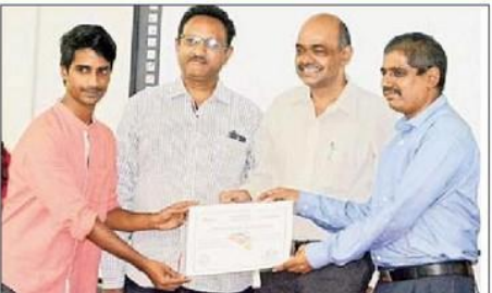
విద్యార్థికి ధ్రువపత్రాల అందజేత