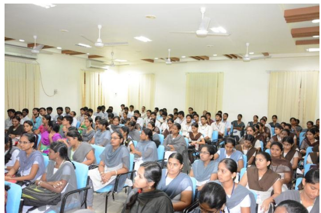
Staff & Students at the Workshop