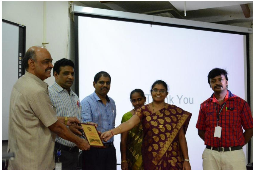
Memento presentation to Prof. & Head Dept. of Computers, PSCMR College of Engineering & Technology