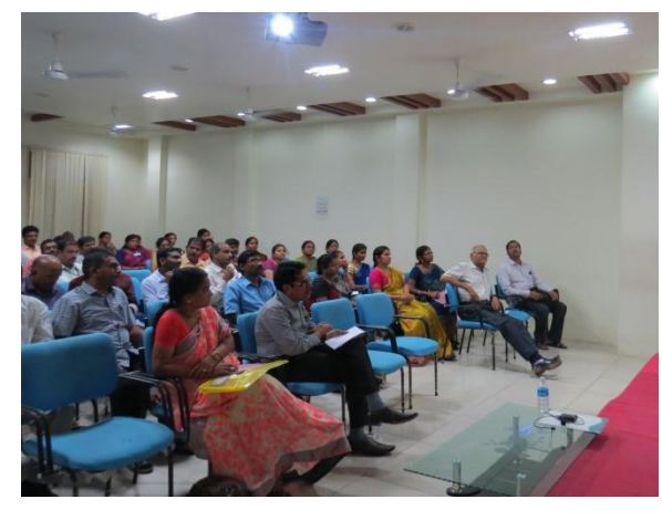
Lecturers at the Technical Session