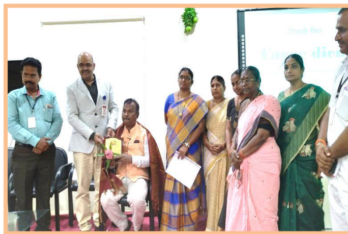
Felicitation to the Resource Person by the Principal, Vice - Principal & IQAC Members