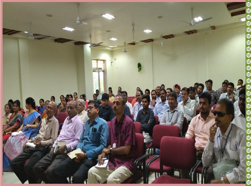
Staff at the Programme