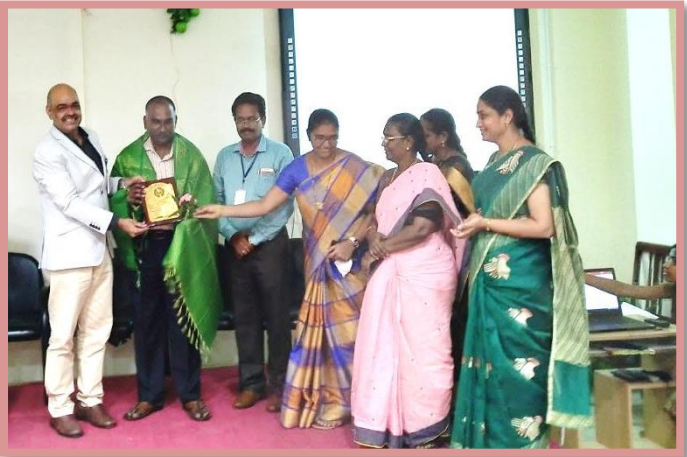
Felicitation to the Resource Person