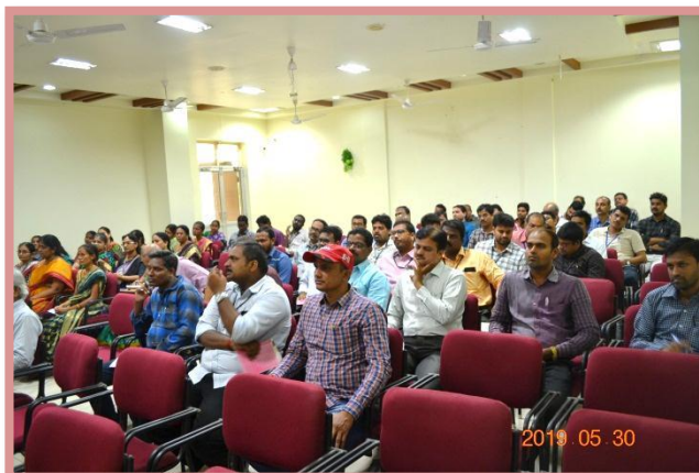
Staff at the Programme