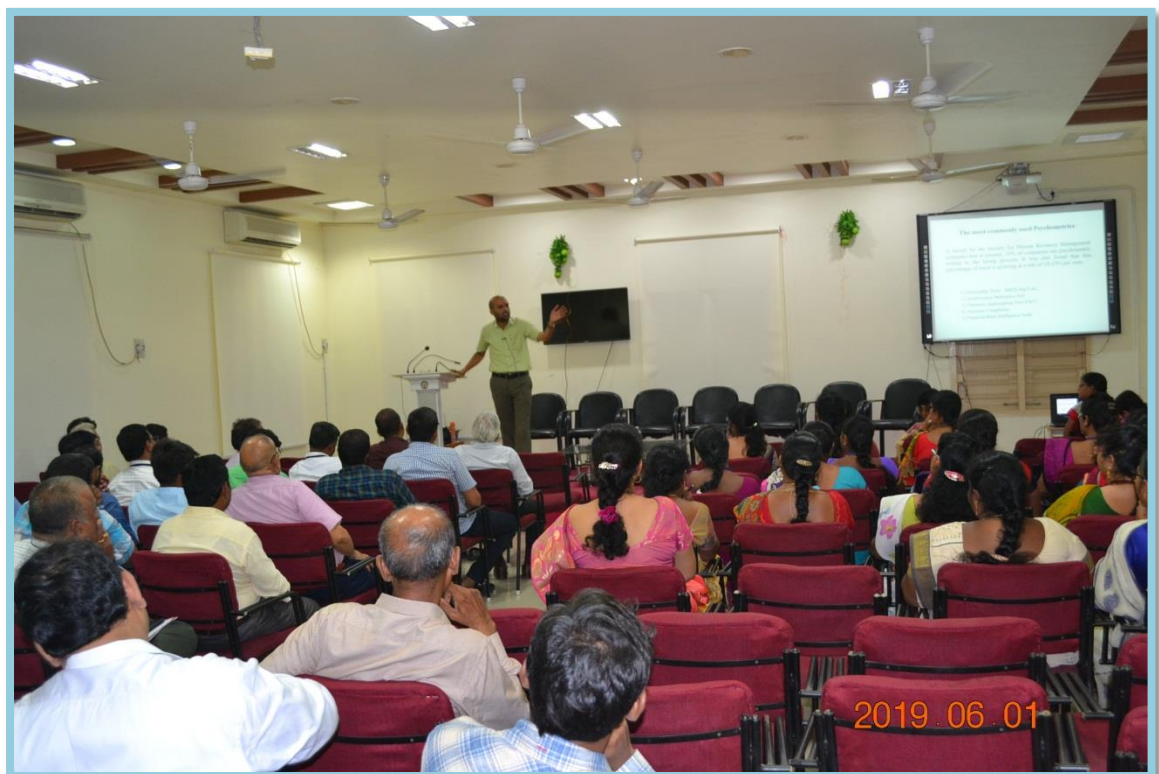
Staff listening his lecture