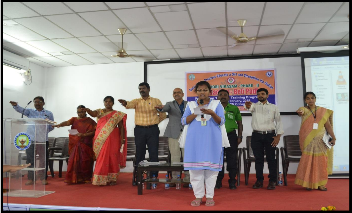
Pledge on Beti Bachao-Beti Padhao