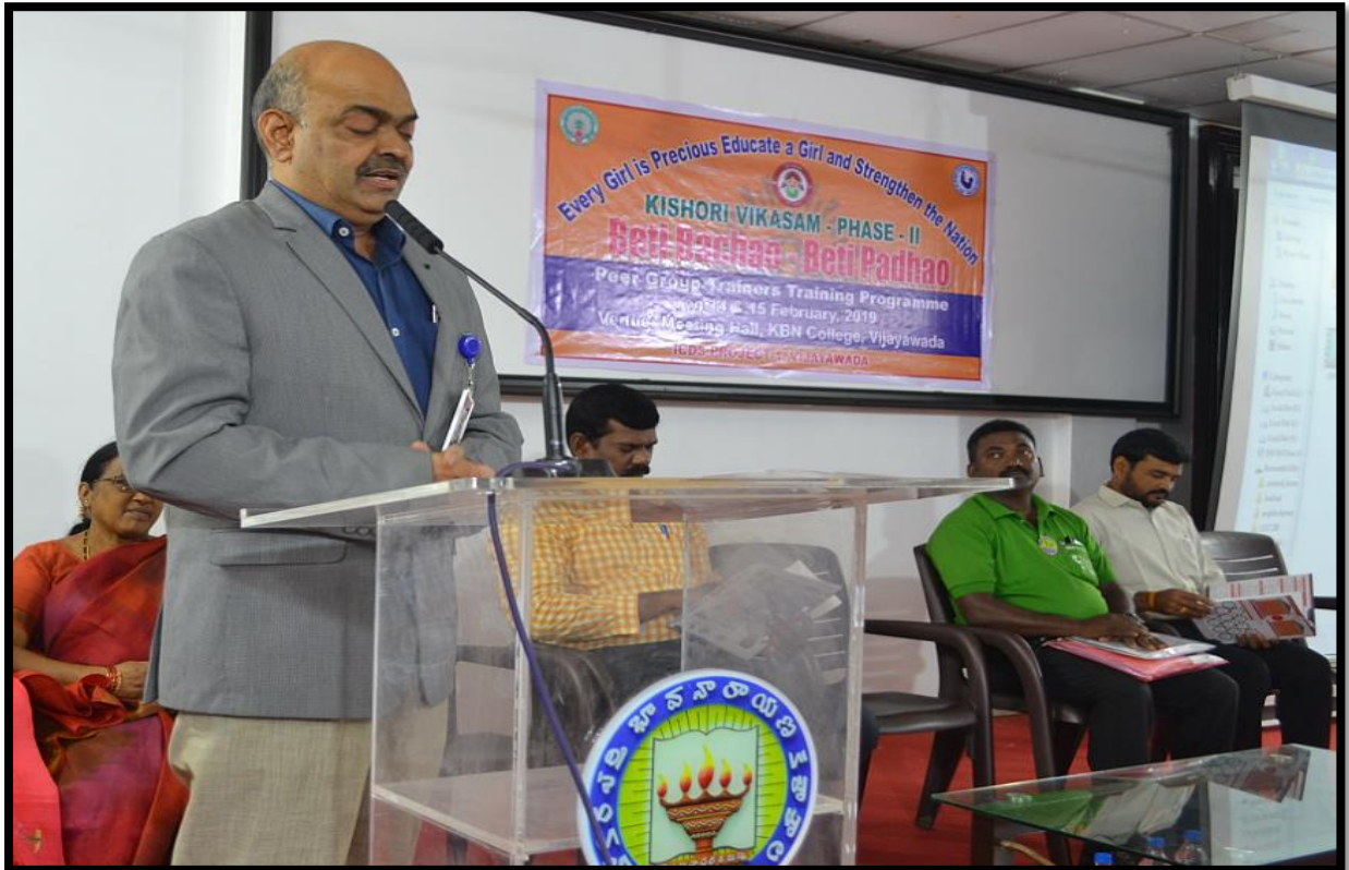
Principal's Opening Remarks