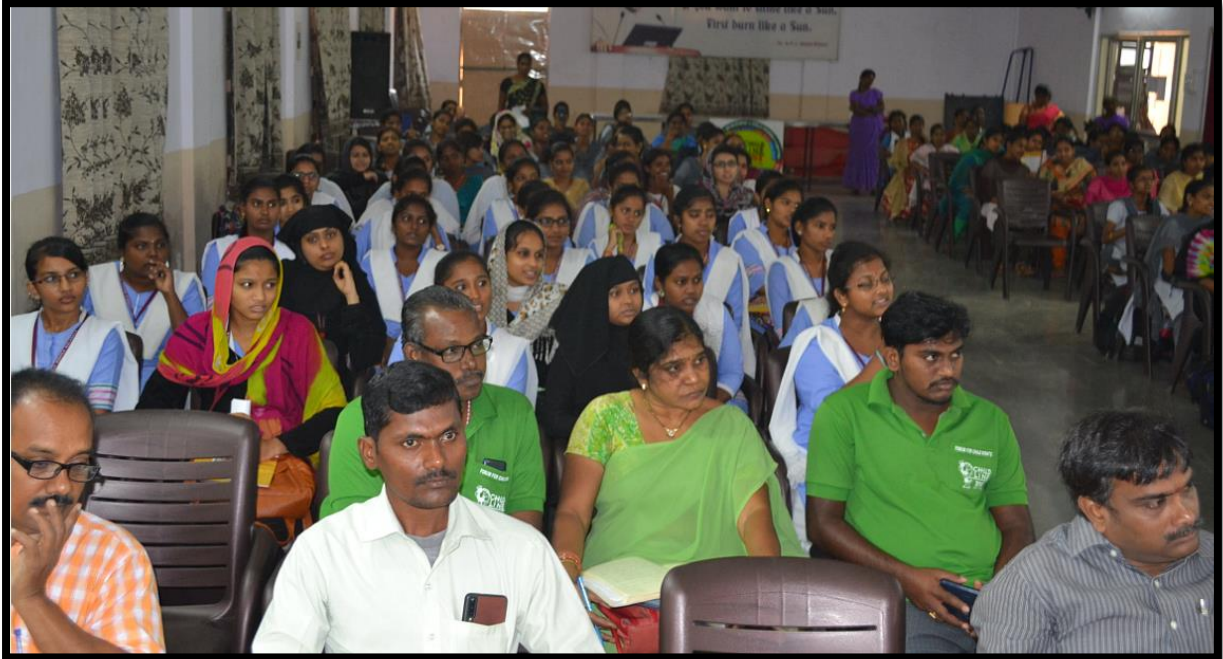
Students at the training programme